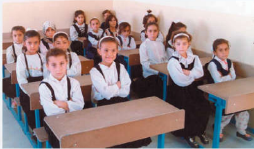
تلاميذ في الصف.