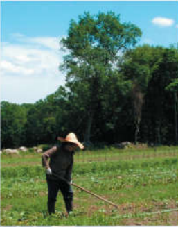
فلاح في الحقل.

ويبارك الله تعالى كل عمل يعود بفائدته للجميع . كما جاء في الآية المباركة أعلاه. وكل انسان يأخذ جزاء عمله و يثمر سعيه . لأن الله الرحمن هو البصير والواعي في كل سعي. حيث يقول: {وَأَنْ لَّيْسَ لِلْإِنْسَانِ إِلَّا مَا سَعَىٰ (٣٩) وَأَنْ سَعْيُهُ سَوْفَ يَرَىٰ (٤٠)} (٢).