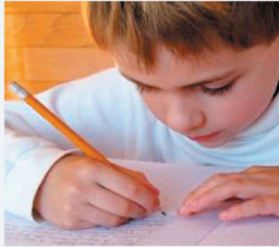
تلميذ يؤدي واجباته