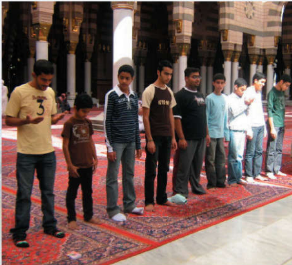
صورة جامع وفيه جمع من المصلين.